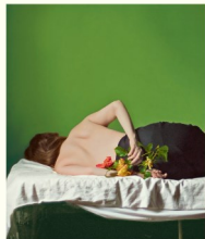
Dror Mishani Drei

Meine erste Begegnung mit diesem Buch geschah in der Buchhandlung meines Vertrauens. Ich war auf der Suche nach etwas Neuem, einem Autor, den ich noch nicht gelesen hatte und plötzlich sah ich dieses Buch auf dem Tisch mit den Neuerscheinungen. Der Titel machte mich neugierig. Ich dachte, dass es sich um nette Seitensprunggeschichten handeln würde, aber nicht um einen perfiden Krimi um einen mehr oder weniger raffinierten, kaltblütigen Mörder, der sich seine Opfer sehr genau