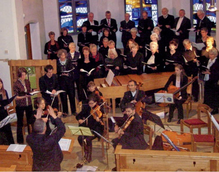
Chor- und Orchesterkonzert