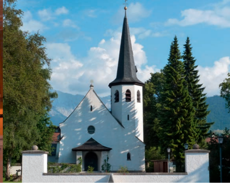
Johanneskirche Partenkirchen (erbaut 1891)