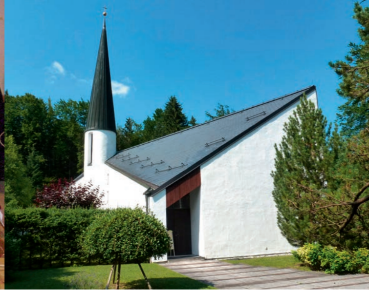
Erlöserkirche Grainau (Architekt: Olaf Gulbransson)