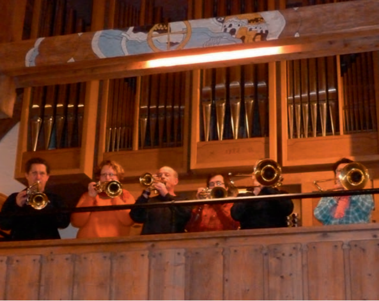
Posaunenchor Mittenwald-Partenkirchen (Pirchner-Orgel)