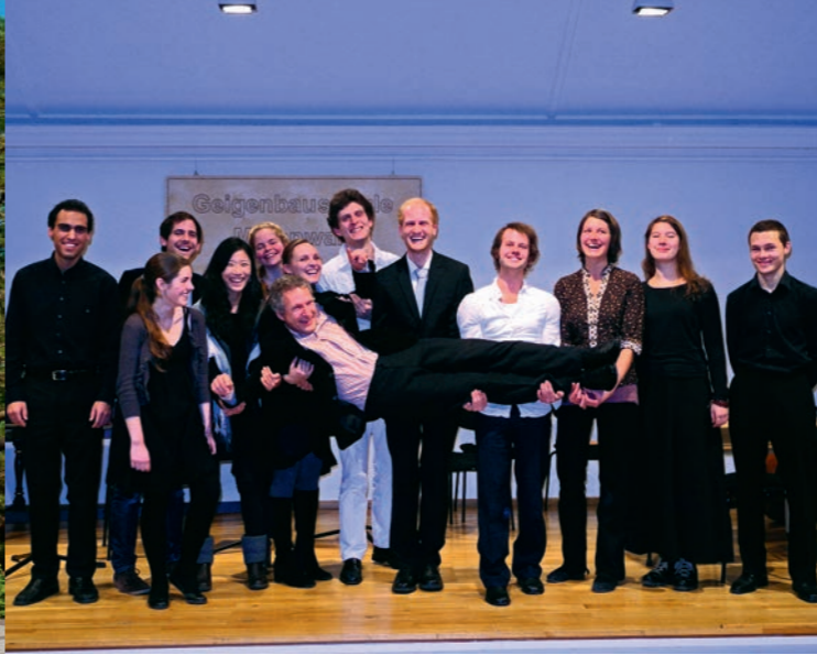
„Cantorix“ Dekanatschor Weilheim